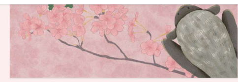
霜毛蝠媽媽日記 之一