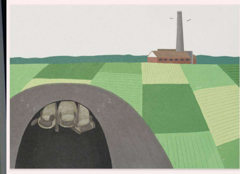
霜毛蝠媽媽日記 之二

櫻花開了，又到了春天，我要準備出發去溫暖的南方，找尋適合我生寶寶的地方。那裡要有蟲可以讓我跟小寶寶，那就準備今晚出發吧！