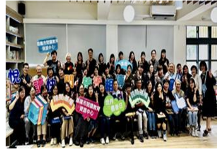
圖7.全市學校社區共讀站-供社區民眾借閱與共讀