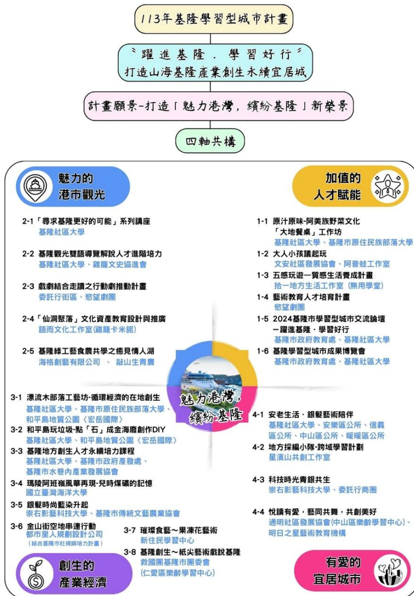
圖 2. 113 年度計畫執行架構圖