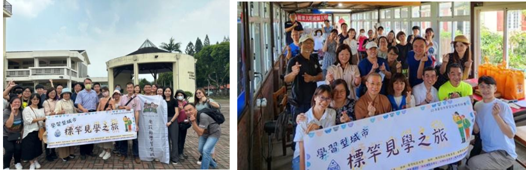
圖 3、圖 4. 基隆市學習型城市標竿見學之旅 112.06.29-06.30.

系，促進城市包容、繁榮和永續發展，打造樂學、樂業、樂活、樂居的學習型城市！」，宣示基隆學習型城市推動的核心目標與方向。113年除將規劃2024學習型城市論壇，並將首度推動『基隆市終身學習月』，利用整個月終身學習活動的串接，以提升民眾對於終身學習的認知、行動力及共創學習風氣。